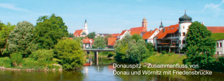
Donauspitz – Zusammenfluss von Donau und Würnitz mit Friedensbrücke