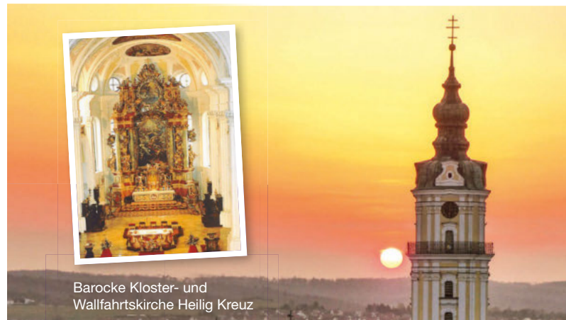
Barocke Kloster- und Wallfahrtskirche Heilig Kreuz