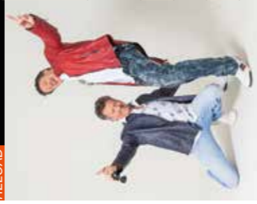
Kapfer & Kapfer