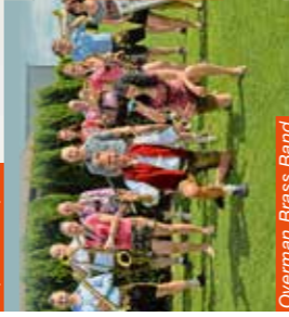
Overman Brass Band