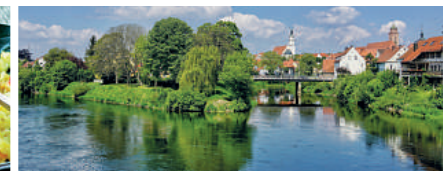
Donauspitz - Zusammenfluss von Donau und Wörnitz